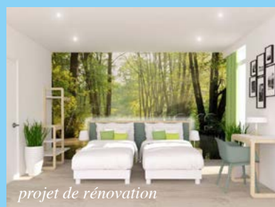
projet de rénovation