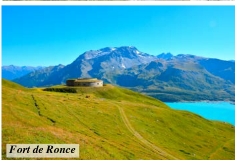
Fort de Ronce