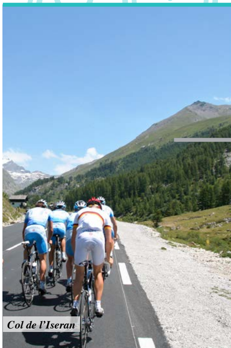
Col de l'Iseran