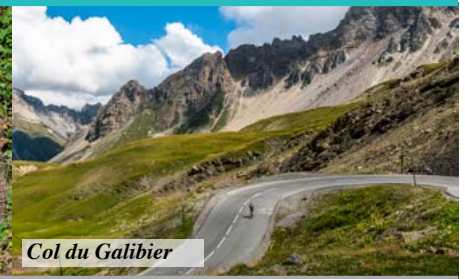
Col du Galibier