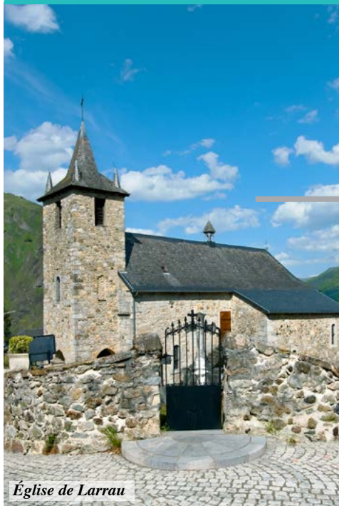
Église de Larrau