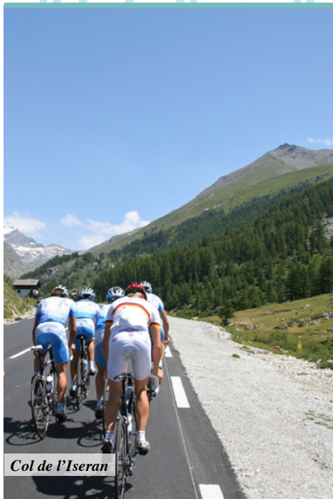
Col de l'Iseran