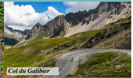
Col du Galibier