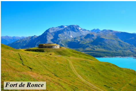
Fort de Ronce